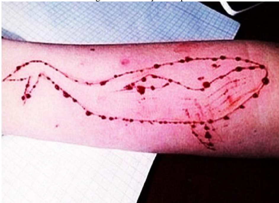
Figura 2: Mutilações na pele